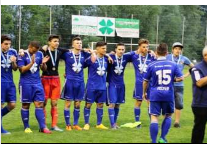
Unsere 1. Mannschaft FC Littau nach der Entgegennahme der Silber-Auszeichnung nach dem Cupfinal FC Littau-FC Altdorf.