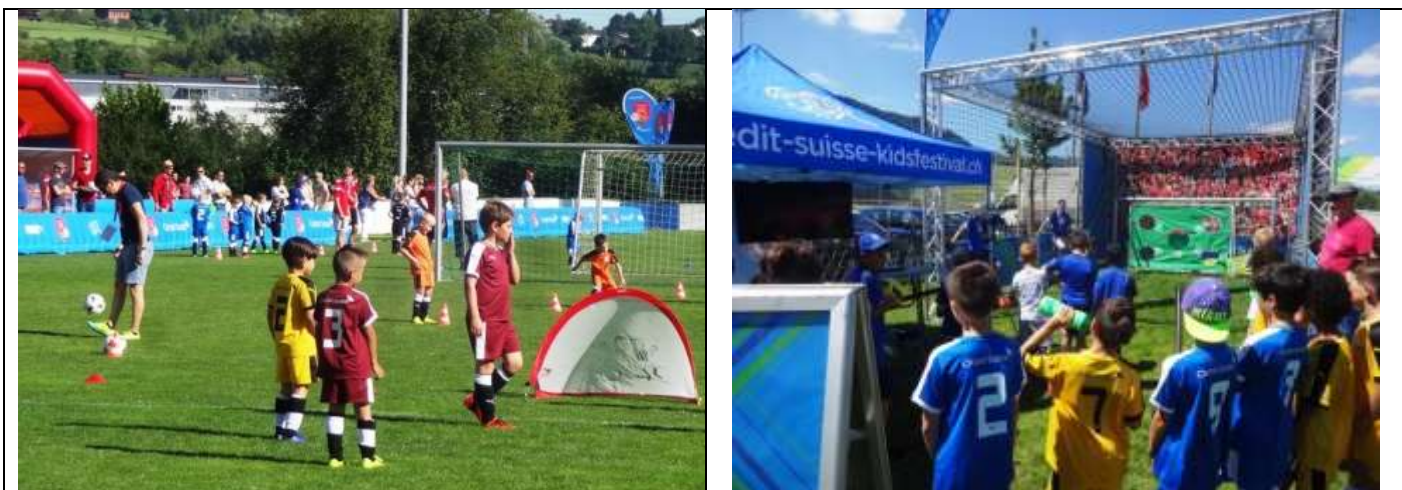
Am SFV-Kids-Festival am 18. Juni 2017 spielten die jüngsten Spieler der G-Junioren ohne Schiedsrichter auf kleine PUGG-Tore.

Im Rahmen des Jubiläums „60 Jahre FC Littau“ bestätigte der Verein seinen guten Ruf als Gastgeber grosser Juniorevents.