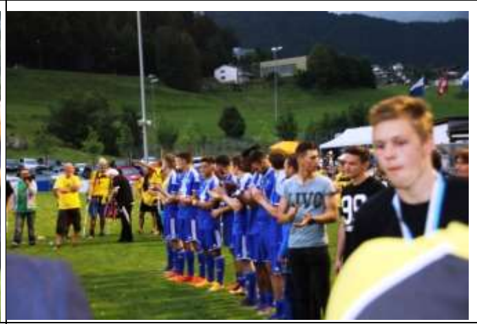
Unsere Mannschaft steht SPALIER für den Sieger FC Altdorf! Respekt für diese grosse Geste.

bk. Ja, Ihr habt am Pfingstsamstag, 03. Juni 2017 FC Littau-Geschichte geschrieben und SPUREN hinterlassen! Der Traum vom IFV-Cupsieg wurde um Haaresbreite verpasst, es fehlten wenige Augenblicke. Aber was Ihr alle auf dem Spielfeld und im Umfeld geleistet habt, hat überzeugt.